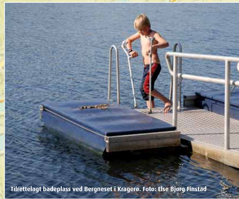
Tilrettelagt badeanlegg ved Bergneset i Kragerø. Foto: Else Bjerg Finstad

Fotografert av S. Humberstad. Foto: Bjørn Erik Lauritzen