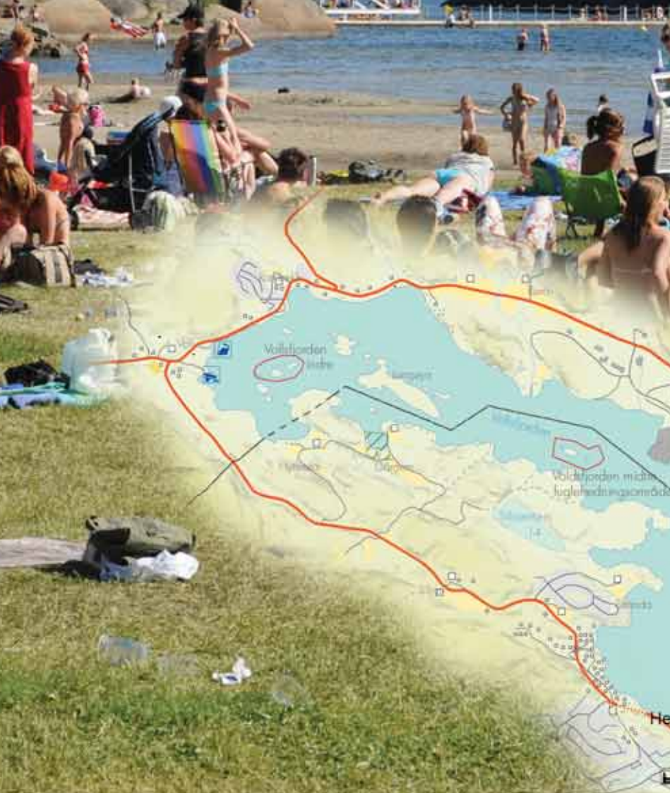
Ølavsetberget med gangbrytte over til Katfjæra.

For mer informasjon se www.telemarkskanalen.no eller kontakt dem på tlf. 35 58 42 00.