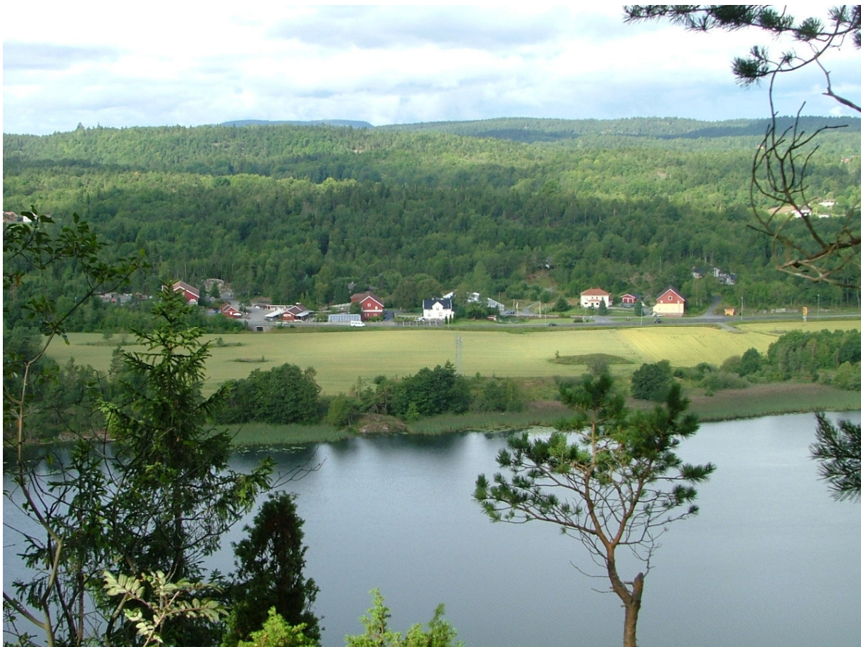
Bilde: Stokke med Stokkevann, Bamble kommune.

Landbruksplanen med vedlegg ligger på Bamble kommunes hjemmesider: http://www.bamble.kommune.no