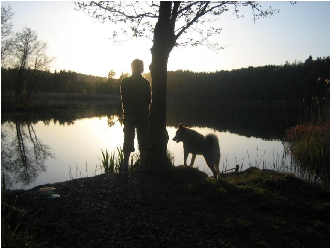
Fiske ved Grobstokvann