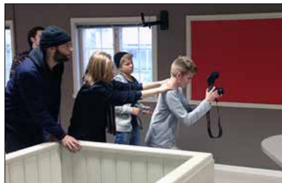
FilmCamp som HeartBeat arrangerte