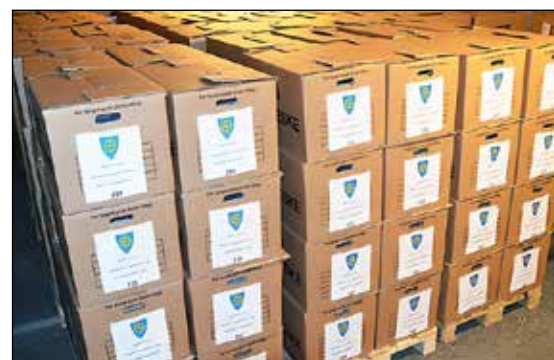
Papirarkivet blir erstattet av digitalt arkiv