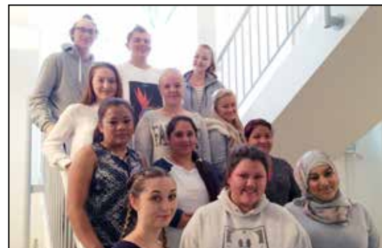
Kommunens læringer i 2016