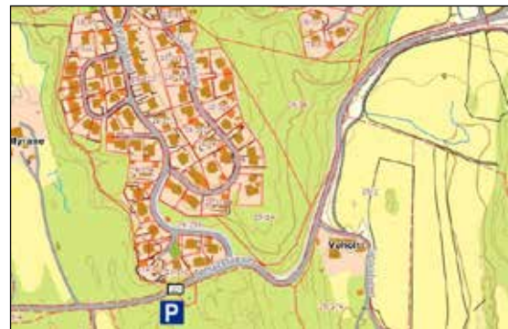
Ny parkering til populære turområder