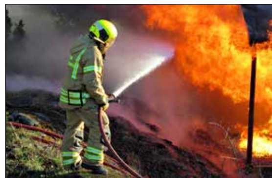
Kompetanseheving i kommunens beredskapsorganisasjon