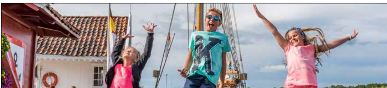
Turister på ferie i Langesund

Bildene i årsmeldingen er tatt av ansatte i Bamble kommune. Ansvarlig utgiver er Bamble kommune ved rådmann Tore Marthinsen. Kommunikasjonsrådgiver Tore Hammersmark har stått for lay-out og produksjon.