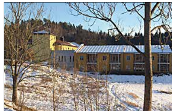
Vest Bamble aldershjem