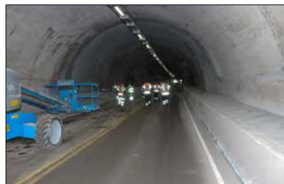
Oppgradering av Høgenhei tunellen.