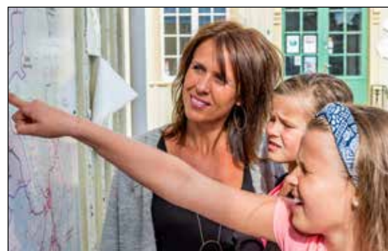
Turister sjekker mulighetene i Bamble kommune