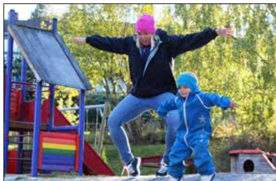
Nasjonal interesse for FIFFEN