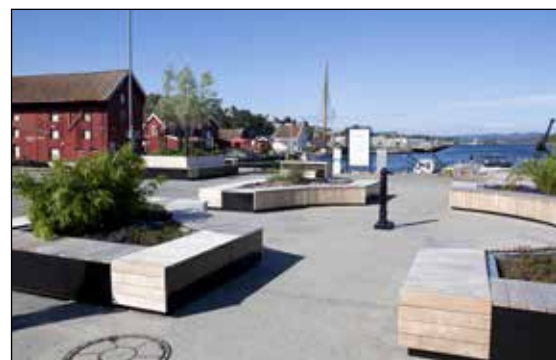
Oppgradert dampskipsbrygge for familiehygge