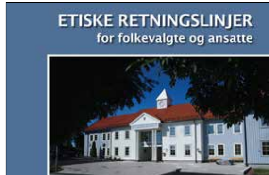
Nye etiske retningslinjer

Vi har igangsatt et arbeid for å kartlegge hvilke tjenesteområder som kan digitalisere sine tjenester og søknadsprosesser. Dette vil ha hovedfokus i 2017.