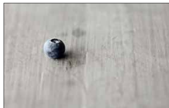
Helsestasjon for voksne