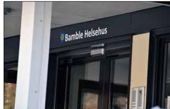
Forsterket skjermet avd. Bamble helsehus