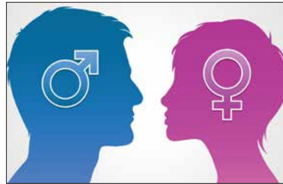
Handlingsplan for likestilling