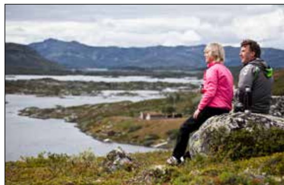
Ønsket om å ha et godt liv