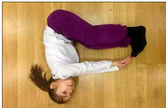
Danser for å skjønne matematiske begreper