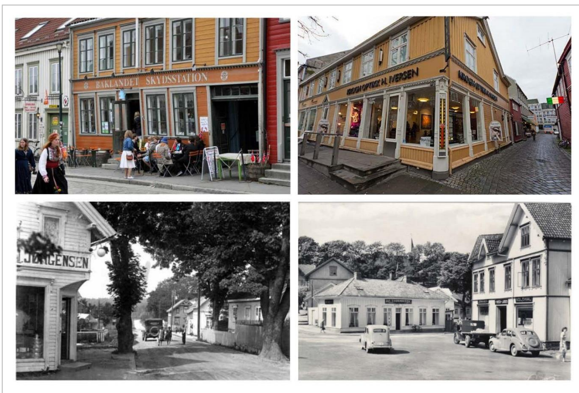
Bilder hentet fra ulike byer og miljøer med det felles at de er tilpasset arkitekturen og stedet

Det bør utarbeides en mer spesifikk skilt og reklameplan for sentrum som er tilpasset arkitekturen og gatemiljøet, jf. Sentrumsplanen for Langesund.