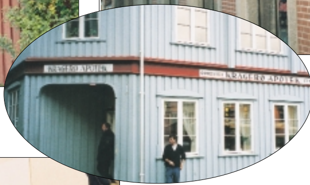
Kragerø Apotek, Kragerø