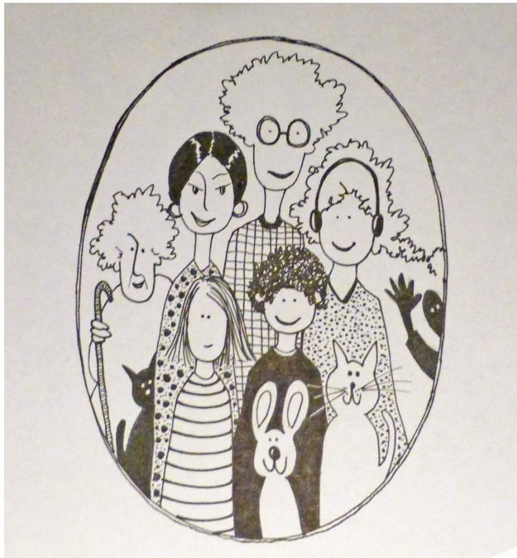
Illustrasjon: Anne Hvål