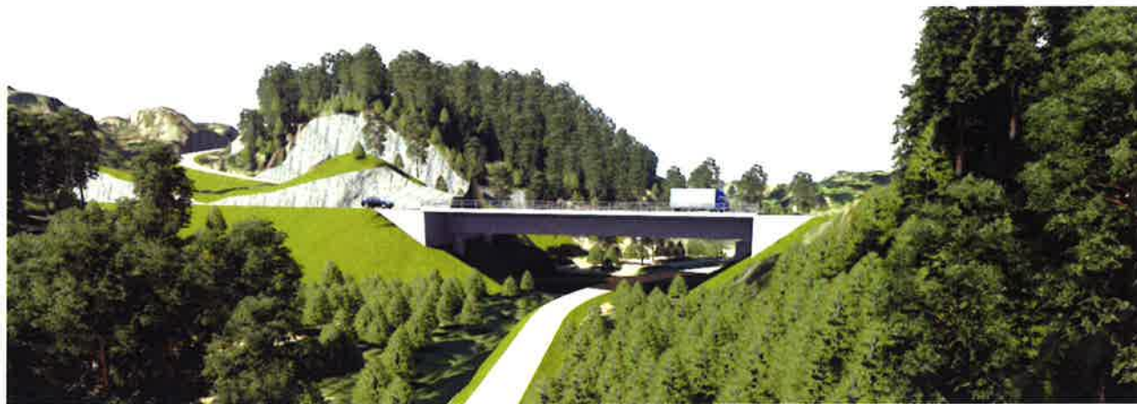
Over: Ny Tinderholt bru som spenner over den flate skogbunnen i dette daldraget.

Den flate skogbunnen under Tinderholt bru avgrenses av terreng i begge endene av brua. Med foreslåtte reduserte brulengde er det liten endring på arealet i bunnen av dalen, siden også den nye brua vil spenne over dalbunnen og treffe terreng på hver side. Bruas utforming er endret ved at det er tatt bort søyle i midten for å åpne opp det frie arealet. Sammen med en justering av Vinterdal og en ny turvegbru i dette delområdet, vil det bli redusert press og redusert sambruk mellom filt og turgåere under Tinderholt bru.