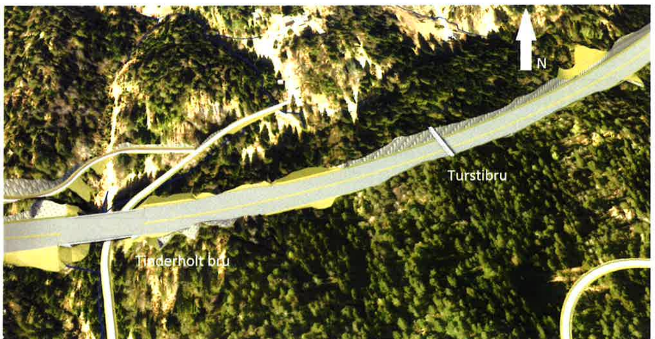
Over: Ny turstibru etableres over E18 øst for Tinderholt bru.

Nye Veier As vil se på en løsning med en turvegbru i området mellom Tinderholtbrua og Vinterdalbrua. En slik bru vil redusere barrierevirkningen for turgåere mellom eksisterende stier nord og syd for ny E 18, og vil redusere effekten av flere funksjoner (vilt og turveier) under Vinterdal og Tinderholt bruer. Turstibrua dimensjoneres for lett trafikk slik at den kan være framkommelig med kjøretøyer av typen ATV for å bidra til økt framkommelighet for beredskap.