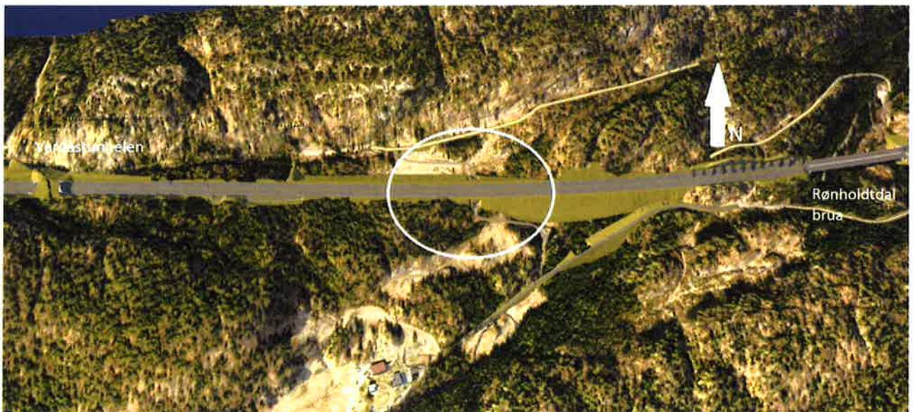
Over: 3D-illustrasjon som viser forslag til ny kulvert vest for Rønholdtdal.

Anbefalinger fra Faun naturforvaltning vil bli ivaretatt med disse forslagene.