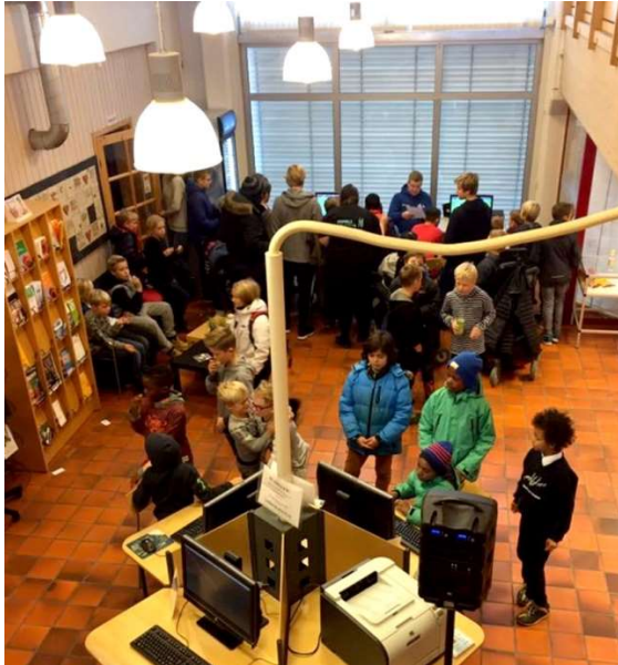
Bilde fra bibliotekets spilldag høsten 2016

På 3.trinn får elevene sitt første møte med biblioteket og blir kjent med alle mulighetene som tilbys der. Elevene vil bli tatt imot av en bibliotekar som forteller dem om hva som finnes i biblioteket og presenterer ulike typer bøker. Bibliotekarene vil lese høyt for elevene, og de får anledning til å se seg om i biblioteket på egenhånd. Det vil også bli arrangert rebusløp med oppgaver i biblioteket.