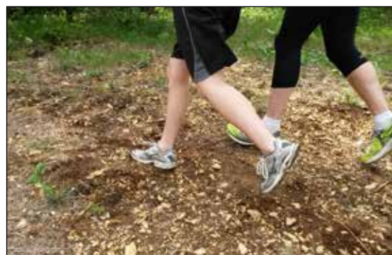
Frisk Bris - mestrings- og rehabiliteringssenter