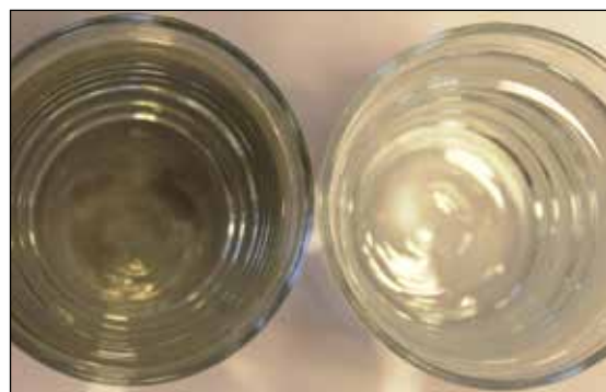
Ubehandlet vann til venstre og behandlet vann til høyre