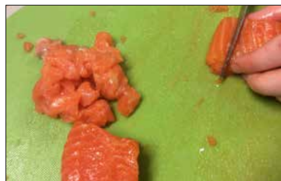
Barn i Uksodden barnehage lager lakseburger