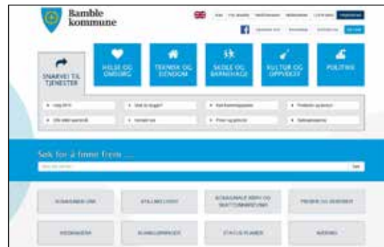
Nye nettsider, her representert ved ny forside