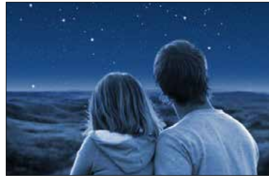
Kriseteamet har bred kompetanse