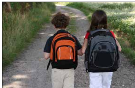
Familieteamet jobber primært med barnevernsaker