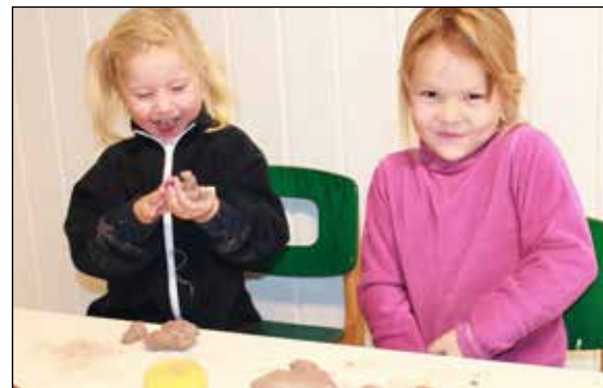
Bruker modellering i kunsten å være sammen