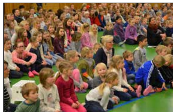
Elever lærer av hverandre på Stathelle barneskole