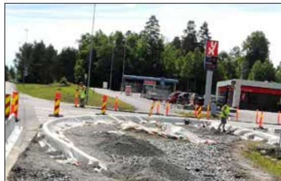
Krysset Tønderveien og Sundbyveien under opparbeidelse