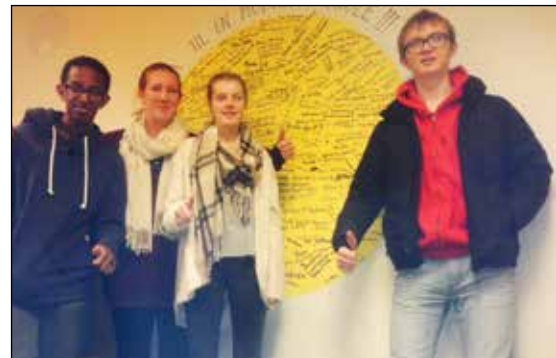
Tommel opp for nulltoleranse mot mobbing