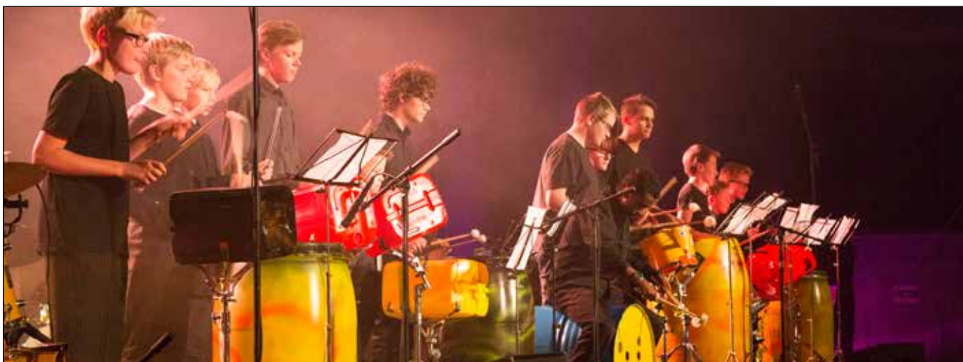
Kulturskolens slagverkelever fremfører sitt "Lyden av Bamble"

Bildene i årsmeldingen er tatt av Per Flåthe og ansatte i Bamble kommune. Ansvarlig utgiver er Bamble kommune ved rådmann Tore Marthinsen. Kommunikasjonsrådgiver Tore Hammersmark har stått for lay-out og produksjon.