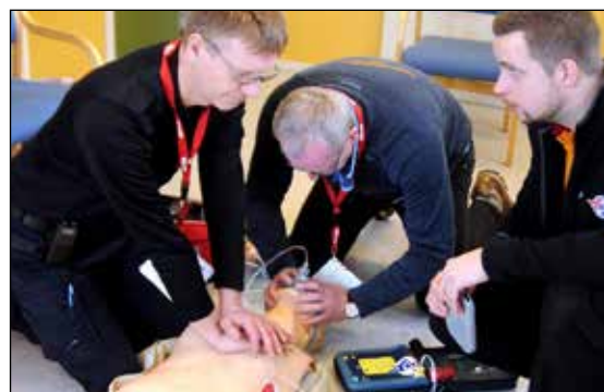
Fra konseptet: "Mens du venter på ambulansen"