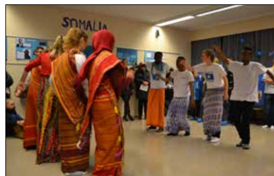
Somaliske elever fremfører dans fra Somalia