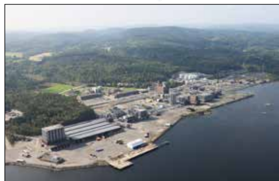
Industriområdet til INEOS

Formålet med avfallsplanen er å verne det ytre miljø ved å sikre etablering og drift av tilfredsstillende mottaksordninger for avfall fra småbåter/lystbåter, og å sørge for at avfall fra disse blir levert til mottaksordning i havnene. Havneansvarlig følger opp avfallsplanen.