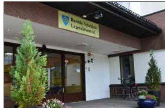
Bamble sykehjem har blitt Bamble helsehus