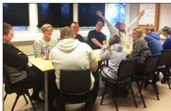
Frisk Bris med ungdomssatsing