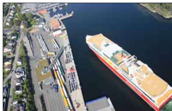
Fjordline legger til kai i Langesund