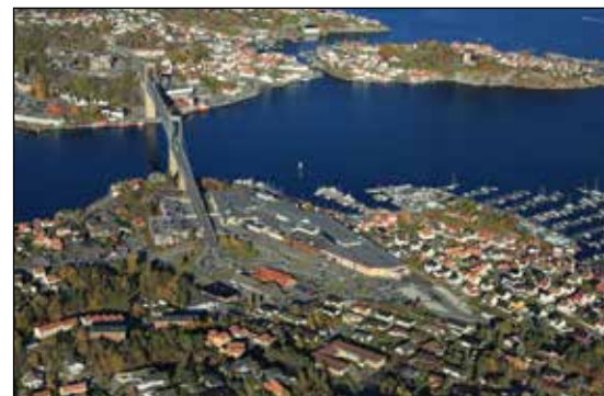
Sammenslåing Langesund og Stathelle sone