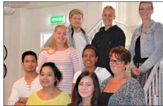
9 av våre nye lærlinger i Bamble kommune i 2014

Oppussing av Halen gård gjorde det mulig å flytte kommunestyrets møter dit. 27. mars ble kommunestyremøtet overført på web-tv for første gang. Dette gjør det mulig for kommunens innbyggere og andre interesserte å følge forhandlingene i kommunestyret direkte. Møtene ligger også med linker på kommunens hjemmeside.