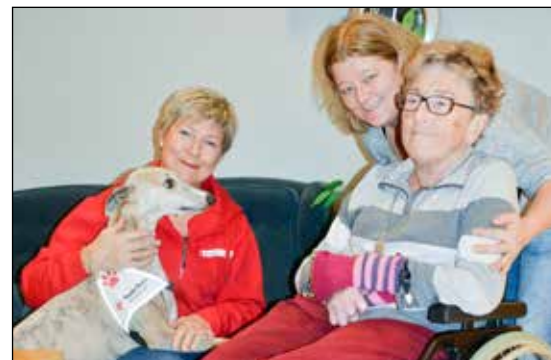
Besøkshund på helsehuset