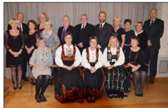
25 og 40 års jubilanter