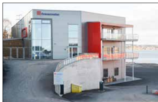
Nyetablerte Cranemaster på Asvall januar 2014