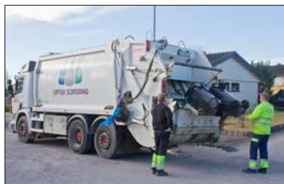
Renovasjon i Grenland som IKS ble opprettet i september