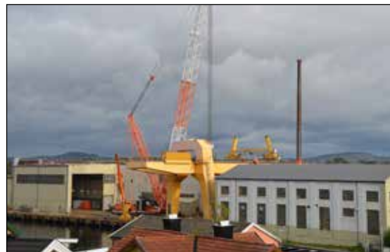
Krana ble revet til fordel for utbygging av Smietangen