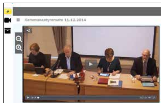
Følg kommunestyremøtene fra din egen stue