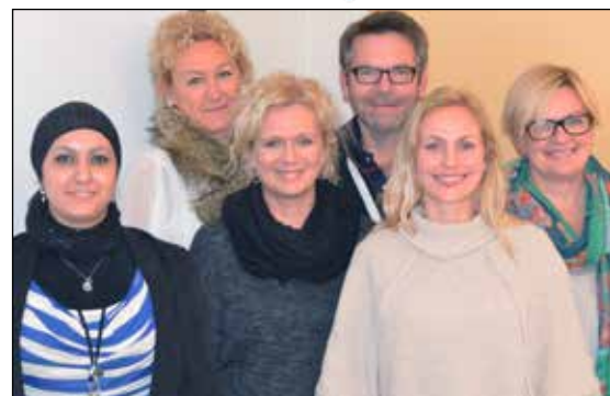
Nav og VIVA sammen om flyktningsprosjekt

Høsten 2014 lagde Frisk Bris og NAV Bamble en modell hvor formålet er å sikre at ungdom som står utenfor skole og arbeidsliv i Bamble, skal få en rask, riktig og koordinert oppfølging. Målet er at ungdom skal få et tilbud uten ventetid som sikrer rask tilbakeføring til skole, arbeid og aktivitet. Denne modellen har vi kalt Frisk Bris Ungdom og er stadig under utvikling.