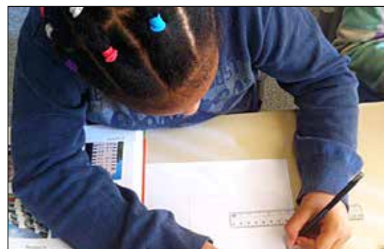
Paletten ble eget tjenesteområde fra 1. januar 2016