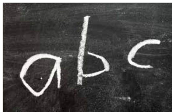
Nurte Aden lærer andre somaliere å lese og skrive