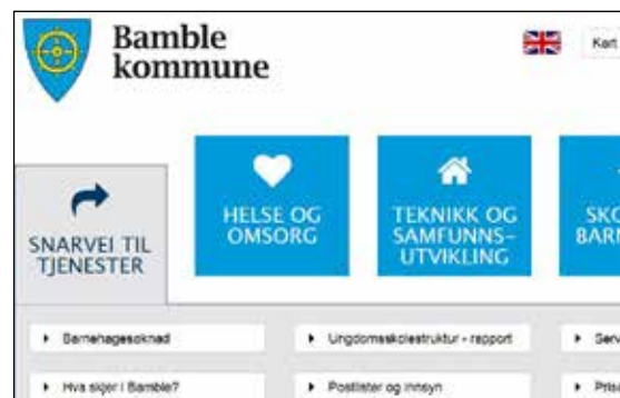
Web portal lansert 6. januar 2015