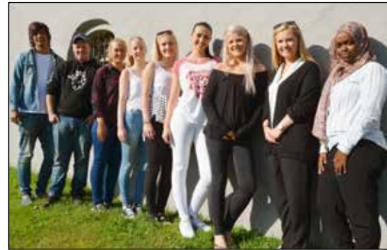
9 av våre nye lærlinger i Bamble kommune i 2015

Dersom du ikke åpner den digitale meldingen du mottar innen 3 dager, vil du få den tilsendt som vanlig brevpost. Ønsker du ikke å benytte digital postkasse, kan du reservere deg og da vil du motta dokumenter i postkassa på vanlig måte.