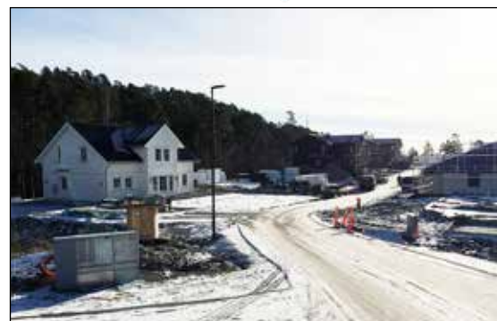
Bygging foregår i Kjærlighetsstien