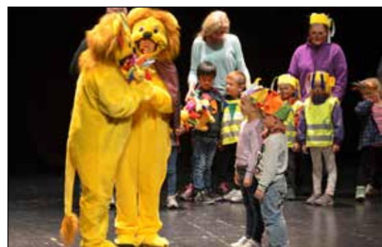
I Bamble kommune er Loveløven viktig