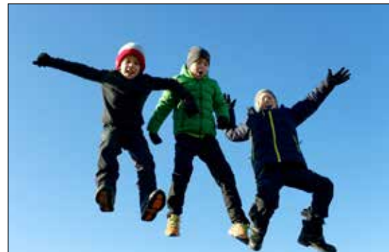
Elevundersøkelsen for 2015 går den riktige veien

Etter forestillingen kom to barn fra hver barnehage opp på scenen for å motta en løve – et symbol på at barnehagene er løvebarnehager.