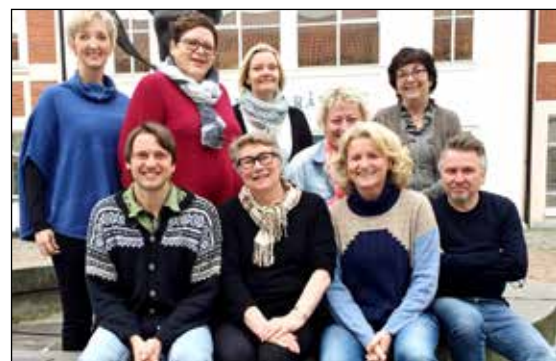
PPT og spesialpedagogisk kompetansesenter