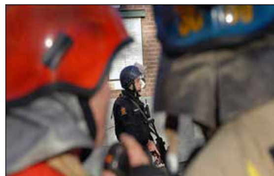
Samvirkekurs med nødetatene