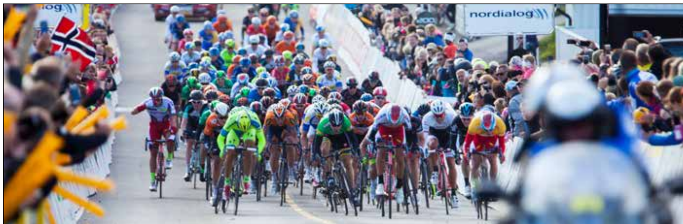
Målgangen i Langesund for Tour of Norway rytterne 2015

Ansvarlig utgiver er Bamble kommune ved rådmann Tore Marthinsen. Kommunikasjonsrådgiver Tore Hammersmark har stått for lay-out og produksjon.