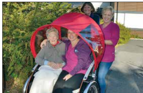
På sykkelturn rundt Dammane