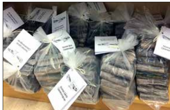
Opptenningsrør produsert på Nustad Gård