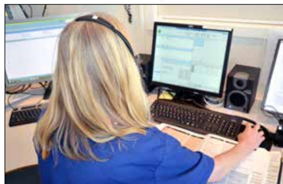
Bamble legevakt ned nytt nødnett