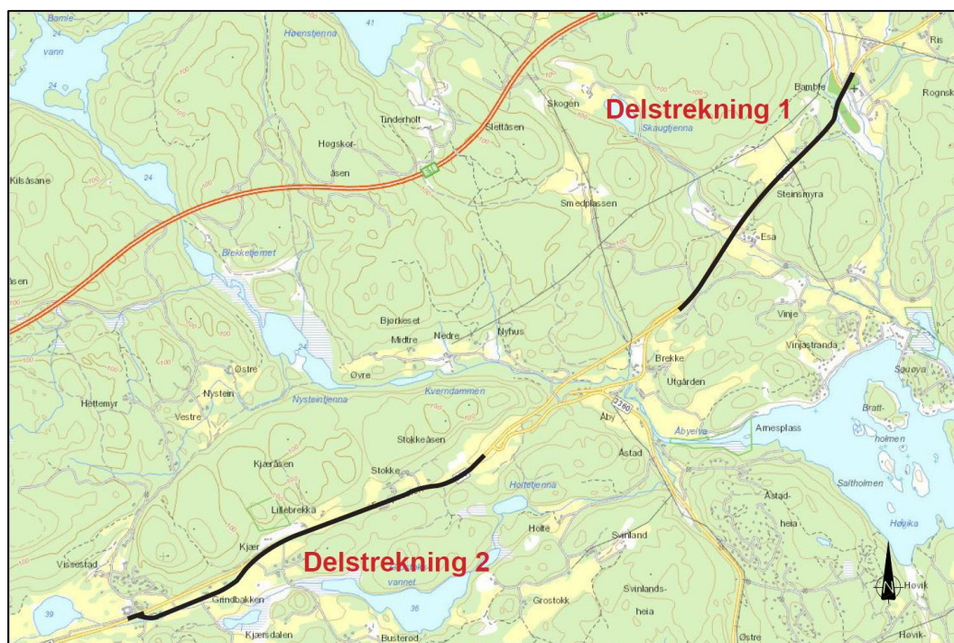
Figur 1: Tiltaksområdet for ny gang- og sykkelveg langs fv. 363 i Bamble kommune. Kartet er generert i Asplan Viak-kartet.

Reguleringsområdet med sine to delstrekninger er vist med sort strek i figur 1. Delstrekning 1 går fra Bamble kirke til Åby (1,8 km) og delstrekning 2 fra Åby til Grindbakken (2,5 km).