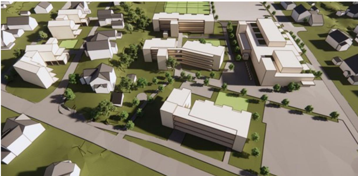
Figur 2 – Volumstudie, utbyggingskonsept