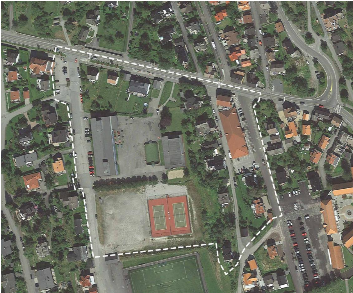
Figur 1 – avgrensing av planområdet