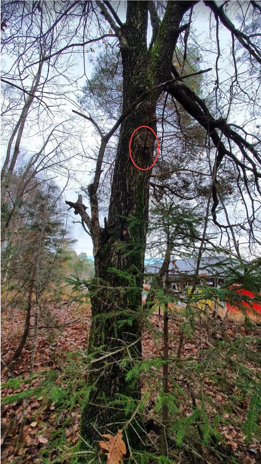
Figur 3. Bilde av den hule eika. Området med den langsgående sprekken er vist med rød ring.