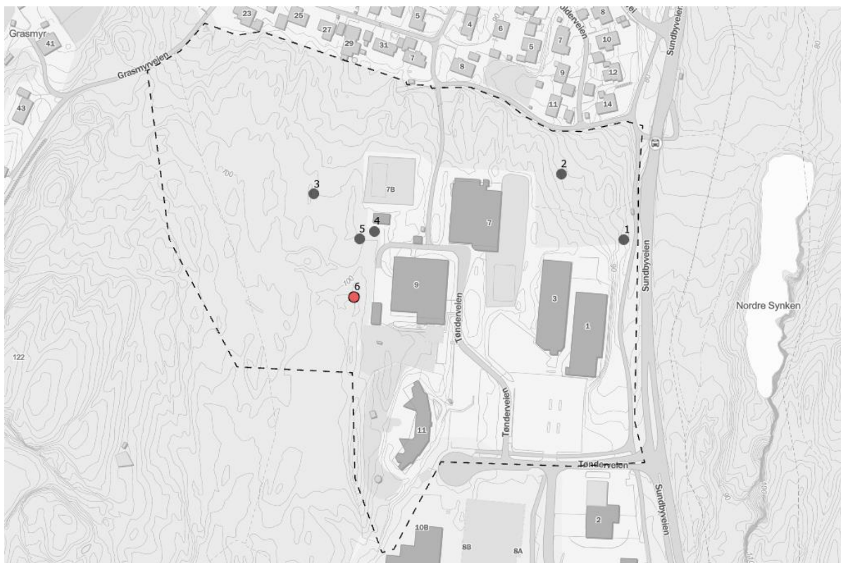
Figur 2. Kart med angivelse av lokaliteter med eiker av litt størrelse. Rødt punkt er hul eik. De øvrige grå punktene er andre eiker som ikke tilfredsstillt kriteriene til naturtypen Hule eiker.