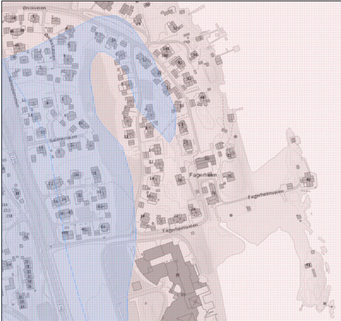
Utsnitt av NVEs temakart «Aksomhet marin leire»

Området ligger under marin grense. I NVEs temakart «Aksomhet marin leire» er ligger planområdet utenfor område med «Mulighet for sammenhengende forekomster marin leire». Vest og nord for planområdet er det registrert områder med mulighet for sammenhengende forekomster av marin leire, se figur nedenfor (blåskravert område). I disse områdene har terrenget helning i andre retninger enn mot planområdet.