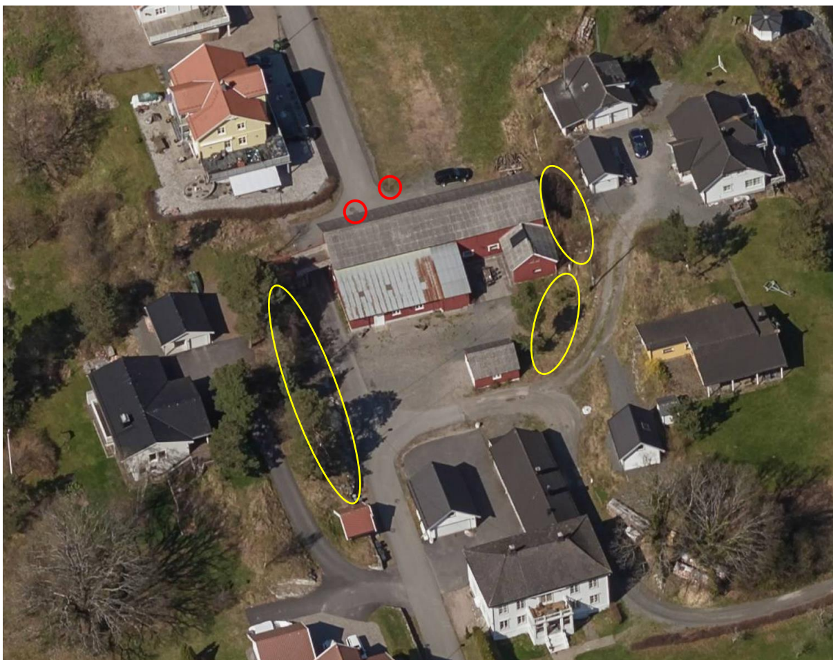
Skråfoto over utbyggingsområdet.