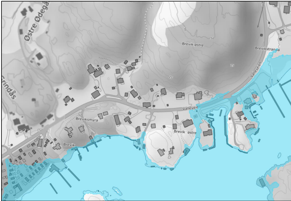
Oversvømte arealer ved stormflo i 2090