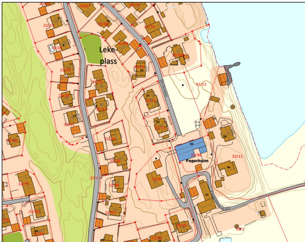
Kartutsnitt som viser eksisterende lekeplass og forbindelsen dit.

Tilstøtende friområder mot nord og mot vest er på til sammen 9,4 daa. Med krav til 25 m 2 felles uteareal pr. bolig for eneboliger og konsentrert småhusbebyggelse vil de regulerte friområdene dekke kravene til ca. 375 boliger, som er ca. 10 ganger flere enn det antall boliger som friområdene skal være for.