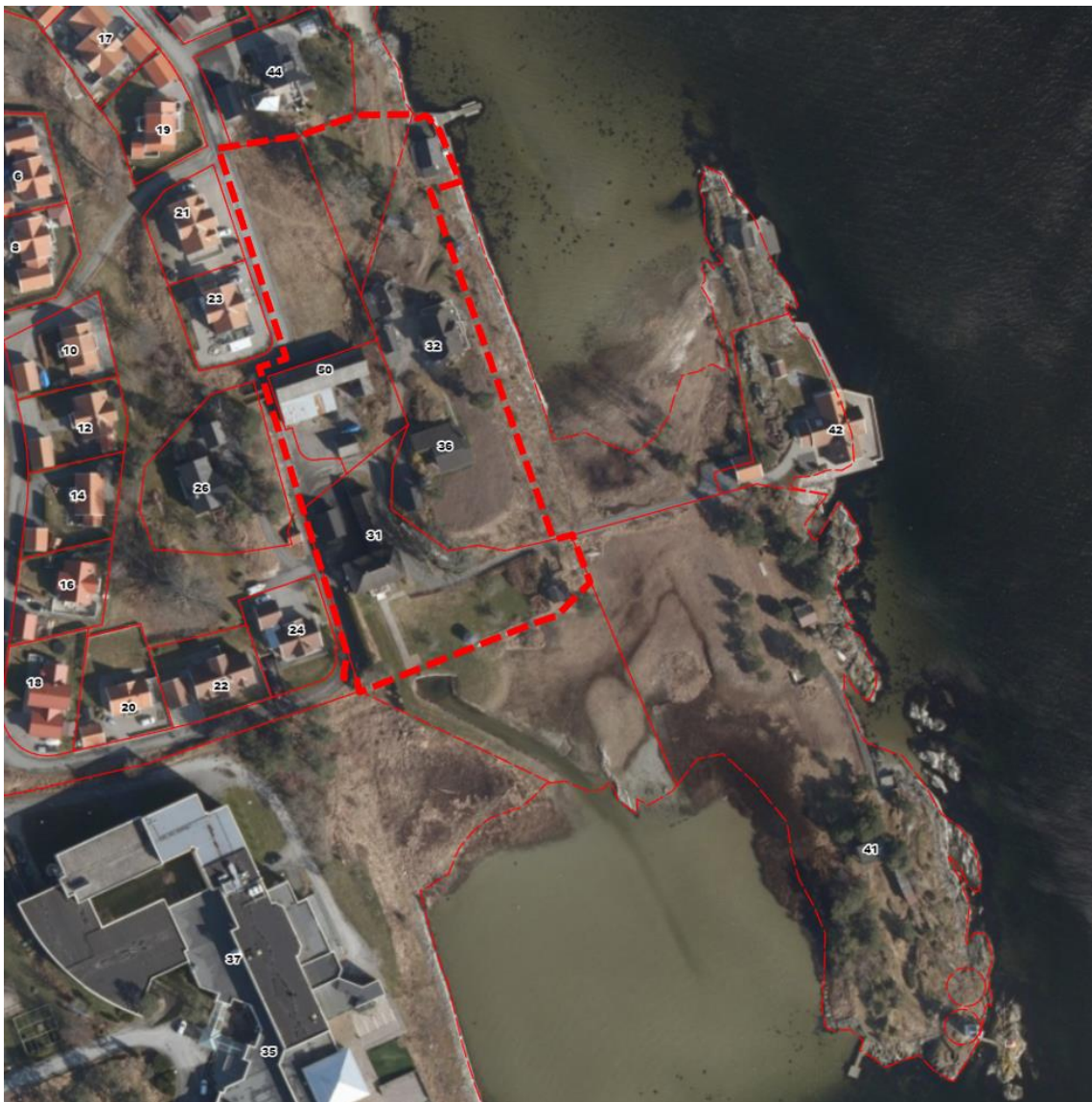
Flyfoto som viser omtrentlig avgrensning av planområdet