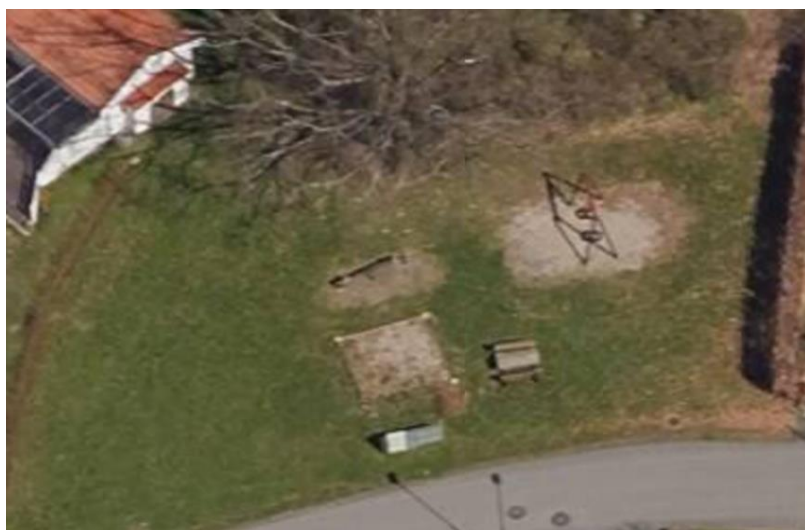
Skråfoto som viser opparbeidet lekeplass

Det er regulerte friområder i umiddelbar nærhet til foreslått utbyggingsområde BK. Området ligger innerst i to adkomstveier, med gs-forbindelse mellom. Det er dermed ikke gjennomkjøring. Området vurderes som trafiksikkert, med lite biltrafikk. Det er en etablert lekeplass ca. 125 m mot nordvest, med adkomst via regulert friområde. Det vurderes at regulerte friområder og etablert lekeplass gir et godt tilbud for barn og unge, og dekker arealdelens krav, selv om avstandskravet blir litt overskredet.