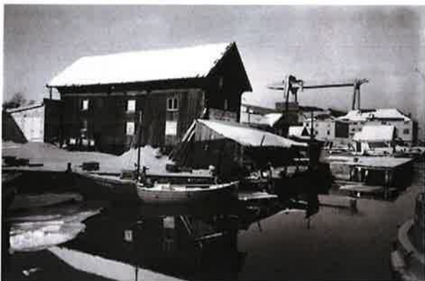
Brygga i Langesund med kranen til Langesund mekaniske verksted i bakgrunnen.