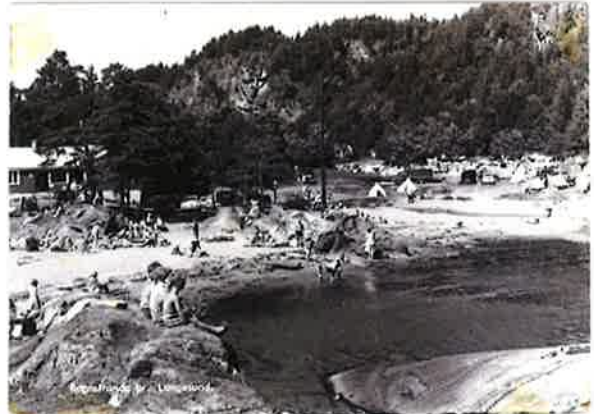
Rognstranda ved Langesund.

Planen avsluttes med en handlingsplan som skal revideres i hver valgperiode. Det er viktig at tiltak får finansiering og de ressurser som trengs for å gjennomføre.