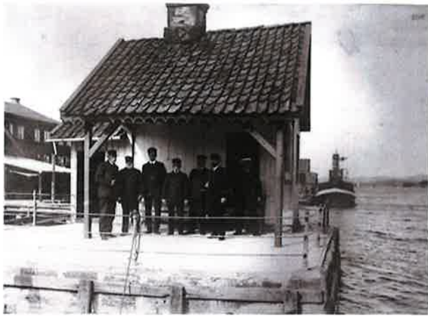
Tollpersonalet utenfor St. Helena.