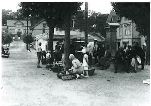
Fra torget i Langesund.