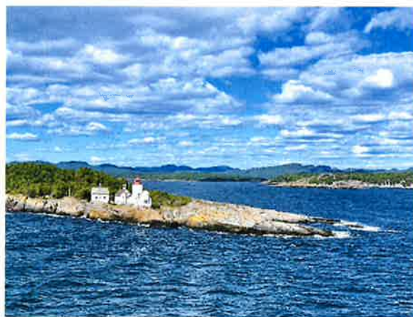
Langøytangen fyr.