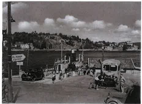
Fergeleie ved Stathelle.