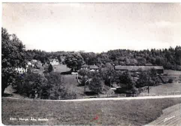
Åby i Bamble.

Flere av de mest sentrale gårdene på Åby er fortsatt bebodd og i drift. Det samme gjelder for den gamle lensmannsgården, "kommunehuset" og landhandelen. Områder rundt Åbyelva er etablert som naturreservat og det er gjort flere funn av bosettingsplasser fra steinalderen i området. Men dagens inntrykk av Åby vitner ikke om et travelt knutepunkt - den historien må fortelles til kommende generasjoner. 28