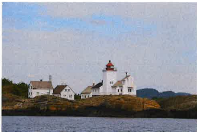
Langøytangen fyr.

landhevning har gjort at det finnes bevart skrogdeler av fartøy fra middelalderen flere steder (ID 113321, 89516, 238336) og sågar en «trosse» eller muligens rest av en innretning datert til jernalder, brukt til å sperre av innløpet til Vågøyhavn (ID 121133). 29