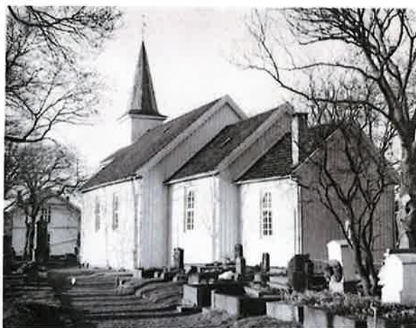
Gamle Langesund kirke.