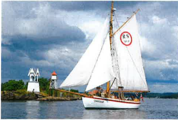
RS2 Langesund med Figgjeskjær, Tåkeklokke-anlegg