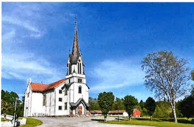
Bamble kirke.

Bamble kirker regnes som Norges første nygotiske kirke oppført i 1841-45 etter tegninger av Gustav Adolph Lammers. Kirken er en korskirke med relativt smale korsarmer av laftet tømmer med utvendig kledning og detaljeringer. Tårnet i vest ble bygget i 1902 (tegnet av arkitekt Haldor L. Børve). Kirken ble restaurert i 1951 og i 1986 ble kirken malt utvendig til dagens farger. Det er 330 sitteplasser i kirken. Bamble kirke er ikke fredet, men listeført som kirke hos Riksantikvaren. I skrivende stund er Bamble kirke under omfattende restaurering.