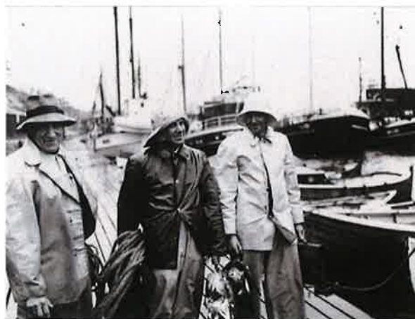
Fiskere på brygga i Langesund.

Ved søknad om rivning eller vesentlig endring av ikke fredet byggverk eller anlegg oppført før 1850 har kommunen i henhold til kulturminneloven § 25 plikt til å sende søknaden over til fylkeskommunen. Søker/tiltakshaver skal legge ved kulturminnefaglig vurdering av tiltaket i sin søknad. Fylkeskommunen skal få anledning til å uttale seg om saken før det blir gjort et vedtak. Hvis et vedtak om rivning eller vesentlig endring er gjort, skal vedtaket umiddelbart sendes fylkeskommunen dersom de har uttalt seg mot rivning eller vesentlig endring.