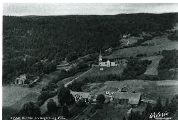
Bamble prestegård og kirke.