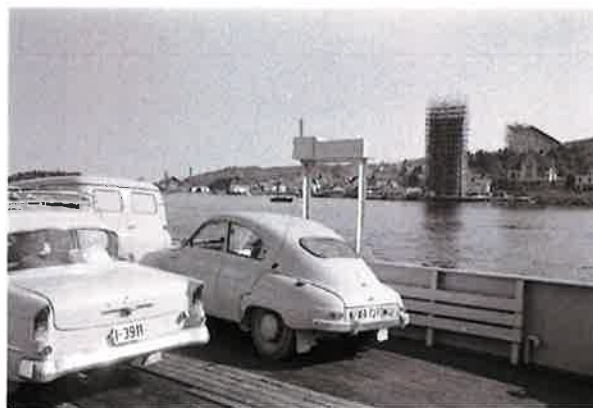
Stathelle juni 1960. Brevik bru under bygging i bakgrunnen.

Vernestatus: Fredet etter kulturminneloven