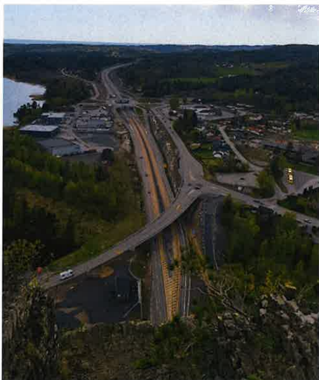
Rugtvedt sett fra Høgenhei.

næringsmessige endringer som eksempelvis på Valle. Samtidig kan etablering av nye veitraseer eller utvikling av nærings- og boligarealer føre til at nye kulturmiljøer oppdages og kartlegges. Som for eksempel i forbindelse med omlegging av ny E18 ved Rugtvedt. I slike situasjoner er det nettopp viktig å ha en plan for kulturmiljøer som kan fungere som et bevisstgjørende og styrende verktøy for administrasjon og politikere i kommunen. Andre eksempler på utviklingsprosjekter som ligger i randsonen for viktige kulturmiljøer er Smietangen og Salentunet i Langesund, Brøtorvet på Stathelle og den nevnte utviklingen ved Rugtvedt.