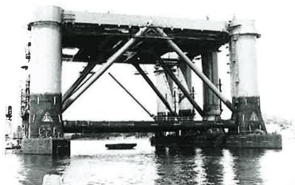
Bygging av Oljeplattform ved Langesund Mekaniske Verksted.