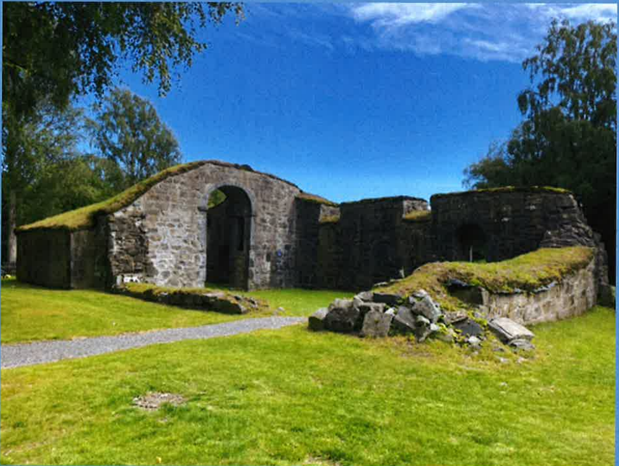
Ruinene etter Olavskirke ved Bamble kirke