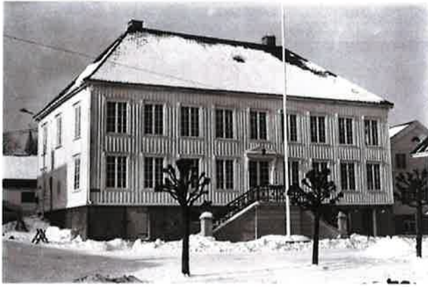
Langesund gamle rådhus, Cudriogården.