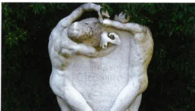
Gravmonumentet Brotherly Love, Langesund kirkegård.