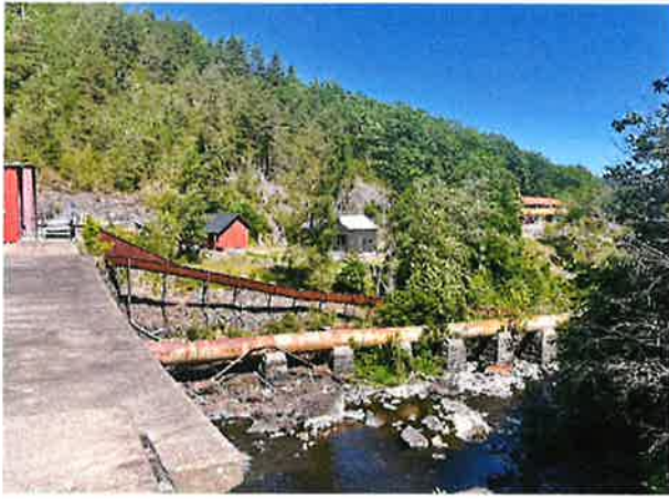
Kongens dam, Herre.