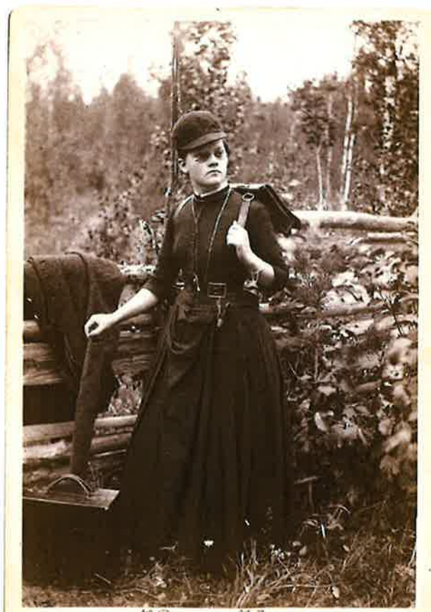
Selvportrett av Marie Høeg ca 1890. Foto: Marie Høeg. Raasepori museum collection, Finland. [CC BY-NC 4.0]

Barndomshjemmet til Marie Høeg er fortsatt bebodd i Søndre Strandgata 10 i Langesund. Huset er utsmykket med blå plakett som forteller om fotografen og kvinnesaksforkjemperen.