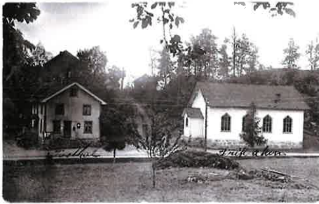
Ødegårdens Verk, ca 1915. Heiabakken rett frem med frikirken til høyre og Ødegaarden landhandel til venstre.