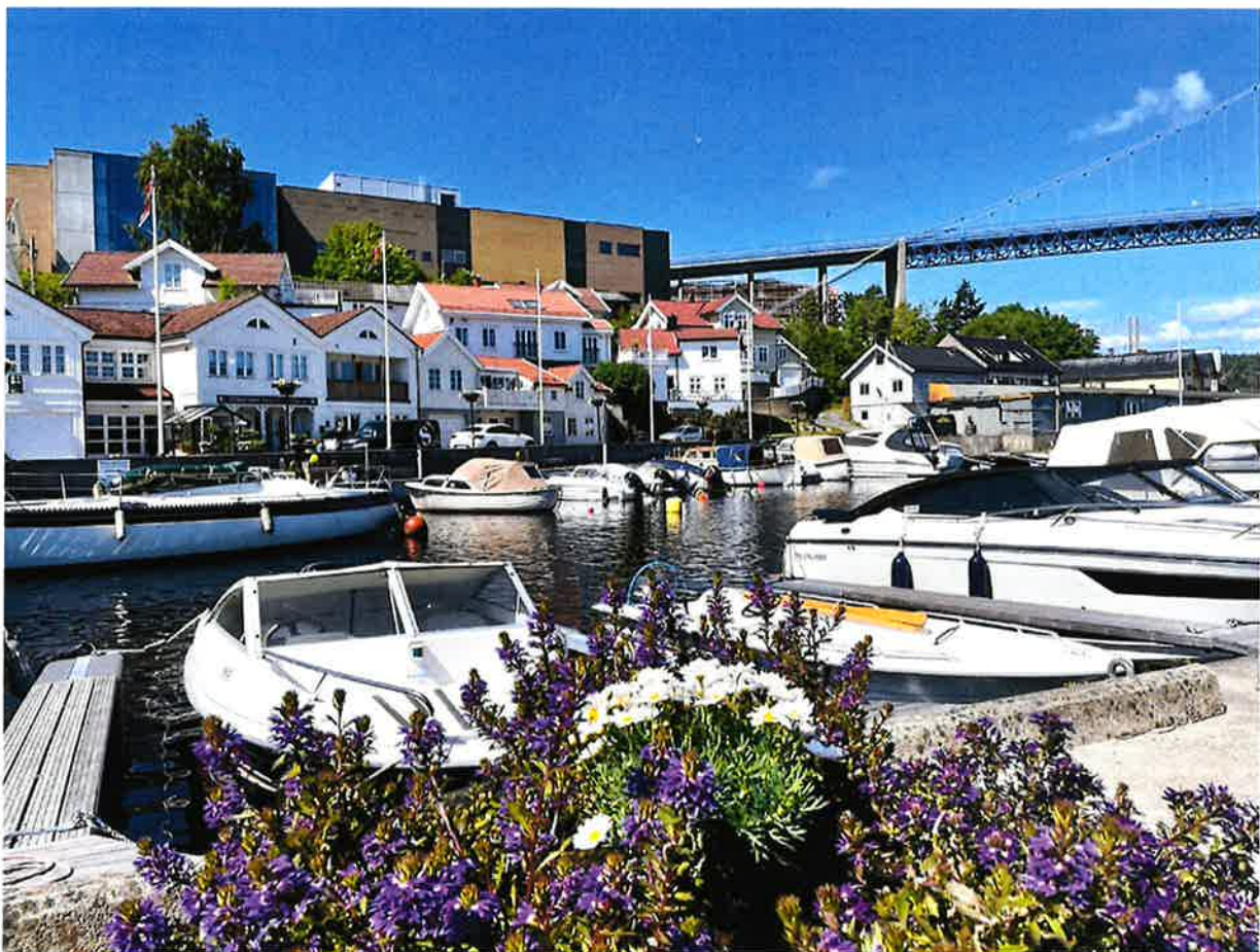
Brygga ved Stathelle.

Det er valgt mål og delmål fra kommuneplanens samfunnsdel der kulturmiljøer kan bidra til måloppnåelse. De kommenteres under.