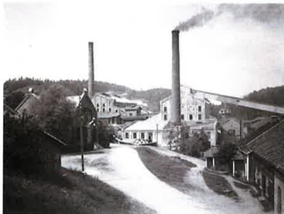
Bamble Aktie Cellulosefabrik, Herre.

1500-tallet. Allerede mot slutten av 1400-tallet ble den første sagen etablert på Herre og i 1713 ble hammerverket satt i drift. I 1888 ble Bamble Aktie cellulosefabrik etablert på Herre.