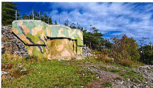
Tangen fort, Langesund.

Status: I dag er det lite informasjon tilgjengelig rundt krigsmerkevesenet, men på Østre Rauen står det fire jernstenger på svaberget og vitner om dette hemmelige kommunikasjonssystemet fra starten av forrige århundre. Det er ingen informasjon på stedet som formidler om dette spesielle systemet og den spente situasjonen langs kysten 36 .