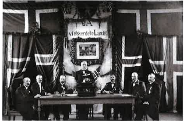
Langesund formannskap ved avstemningen i 1905.

Maritimt museum (tidligere Norsk sjøfartsmuseum) er et landsdekkende museum for sjøfart, kystkultur og marinearkeologi. Maritimt museum har et bibliotek som dekker museets fagområder innen Norsk skipsfart- og handelshistorie, rederihistorie og sjømannsorganisasjoner, fartøyvern og kystkultur, maritim arkeologi, båt- og skipsbygging, fiske- og fangsthistorie, navigasjonshistorie, maritim kunst og sjømannsfolklore. Man kan i tillegg finne spesiallemner som polarhistorie, los-, havne og redningsvesen, lokalhistorie og marinhistorie og litteratur knyttet til museumsgjenstandene. Museet har også arkiv som inneholder 650 hyllemeter med til sammen 600 privatarkiver som består av skips- og båttegninger, manuskripter og kart. Det er også skipsregister som gir forskjellige opplysninger om fartøyer, alt fra byggeår til skipsførere. 3