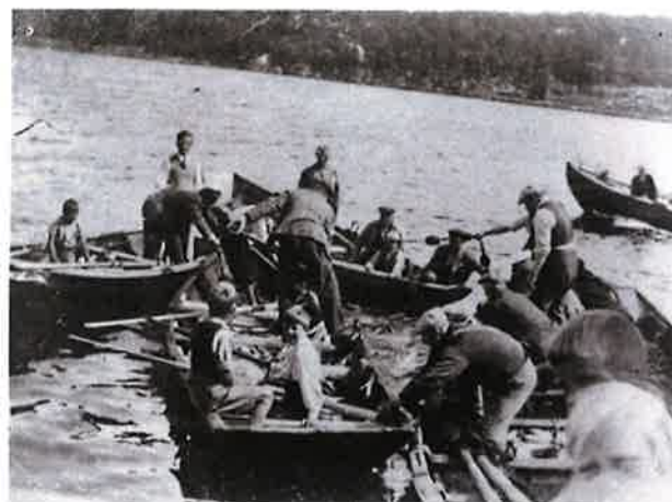
Fjordfiske etter sild i Bamble, Foto: Telemark museum

Bambles kyst strekker seg fra innerst i Fossingfjorden gjennom gamle Bamble kommune med øyer og skjærgård ved Valle, Våg og Havsund mot Åby. Gjennom Langesund og langs