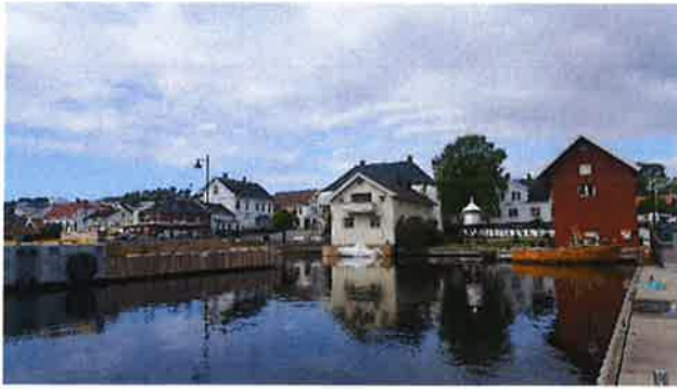
Bymiljø fra Langesund.