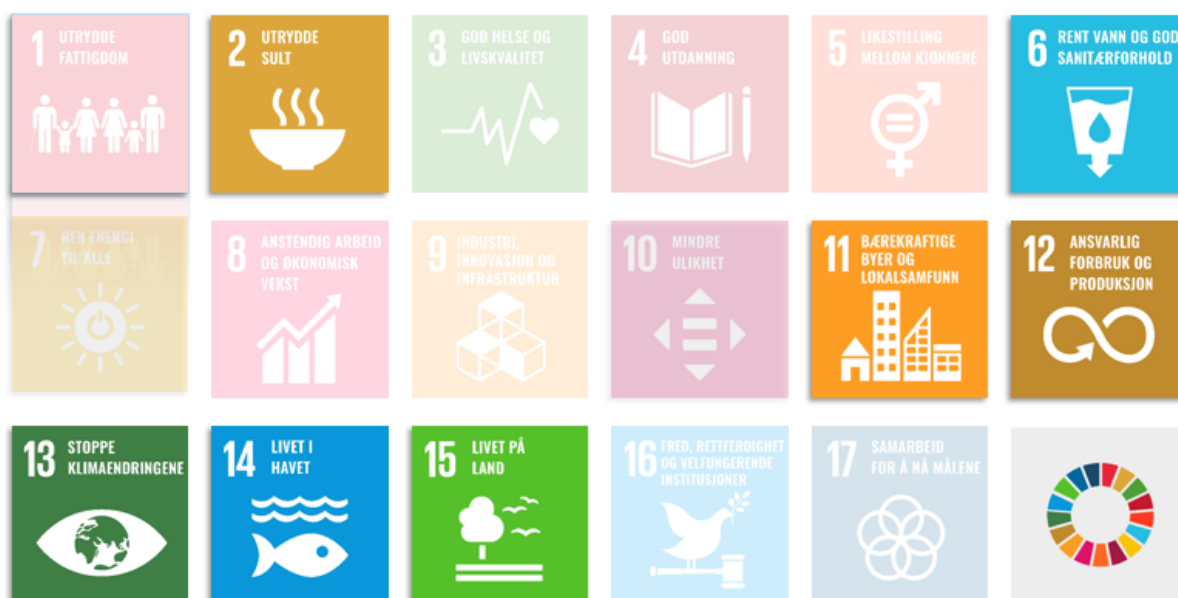
Figur 1: FN's 17 bærekraftsmål som har 169 delmål

Planen er utarbeidet av landbruksforvaltningen med representanter fra organisasjonene Bamble Bondelag, Bamble Skogeierlag, Fiskeri og Primærnæringsutvalget.