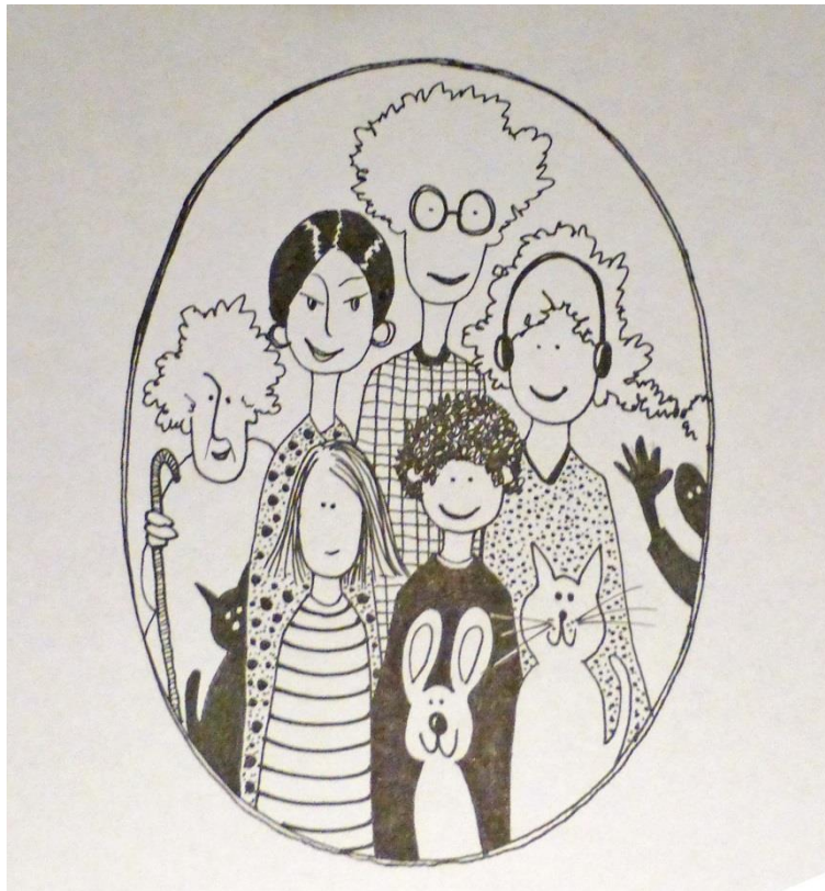
Illustrasjon: Anne Hvål